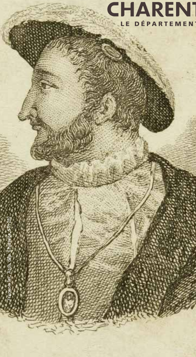
François 1er

ARCHIVES DEPARTEMENTALES DE LA CHARENTE ●