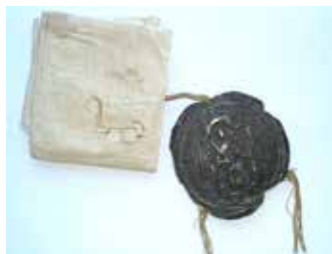
Sceau de François 1 er, 1515.

Sources : rapports de fouilles, correspondances... Niveau 6 e