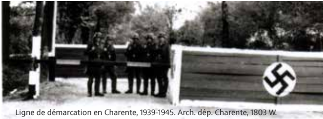
Ligne de démarcation en Charente, 1939-1945.

Etudier l'évolution des différents actes de résistance commis en Charente entre 1941 et 1944 après un retour sur le contexte local. Sources : rapports de police, photographies. Niveau 3 e et Terminale