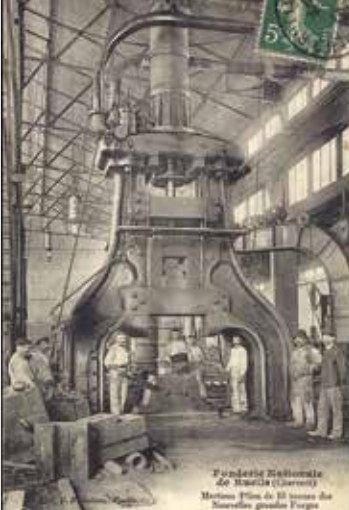
Marteau-pilon à la Fonderie de Ruelle, 1909. Arch. dép. Charente, 26 Fi 248