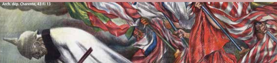
Arch. dép. Charente, 43 Fi 13

Démarche : appréhender la recherche documentaire aux Archives à partir de l'étude du cadre de classement et des instruments de recherche (répertoire dactylographié, Intranet lecteur). Durée 1h.