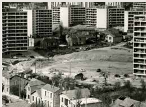
Construction, grands ensemble de la Grand-Font. Arch. dép. Charente, 27 Fi 167

Démarche : rechercher dans les fonds d'archives les traces de l'histoire communale afin de proposer le nom d'une personne, décédée ou vivante (des arts, des lettres, un sportif, un ancien maire, un résistant, un poilu) dont les faits ont marqué la commune. (Délai de prévenance de 2 mois). Cycle 3.