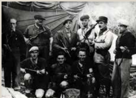
La Section Spéciale de Sabotage, 1944, photographie 10x15cm.

Ouverture : samedi 14h - 18h / dimanche 10-18h